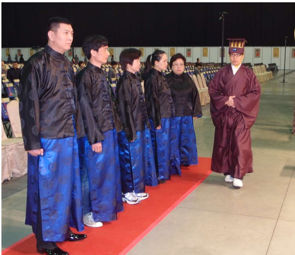
當贊生經過時，陪祭官須轉身對面站。(5.6)