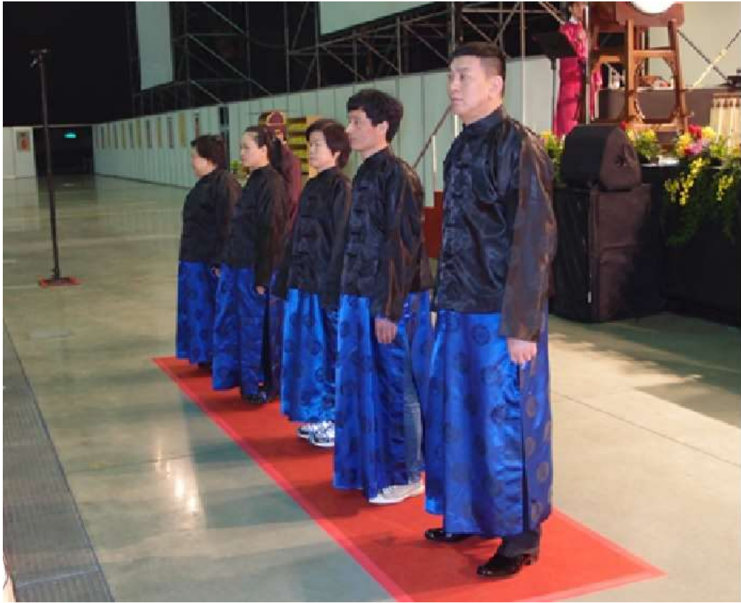
當扇繖經過主祭官身旁，通贊唱：「相對班」，陪祭官聞聲自內轉身面對大門。(5.7)