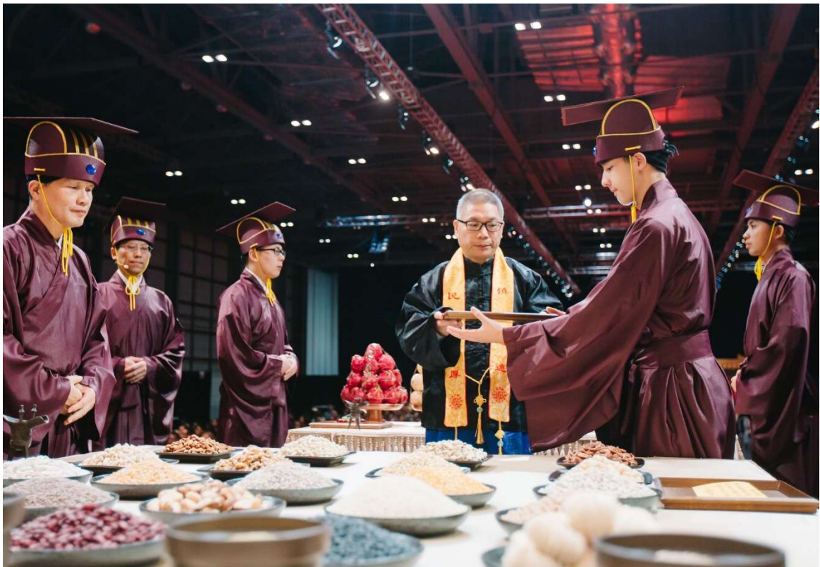
禮畢，左禮生左臂於盤下，左轉九十度接回，置供桌或香案左側。(11)