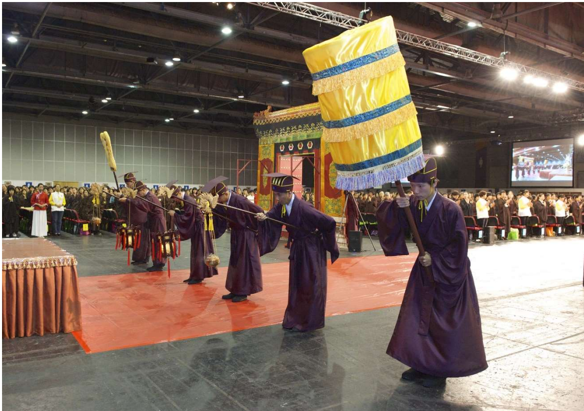
迎神送神行三鞠躬禮，為求整齊劃一，須指定專人輕聲喊口令。鞠躬時只須人鞠躬，燈爐維持原姿勢，無須向下行禮。(7.4)