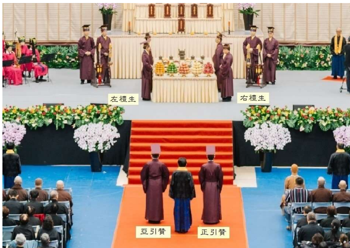
主祭官右邊稱右禮生及正引贊，左邊稱左禮生及亞引贊。(1)