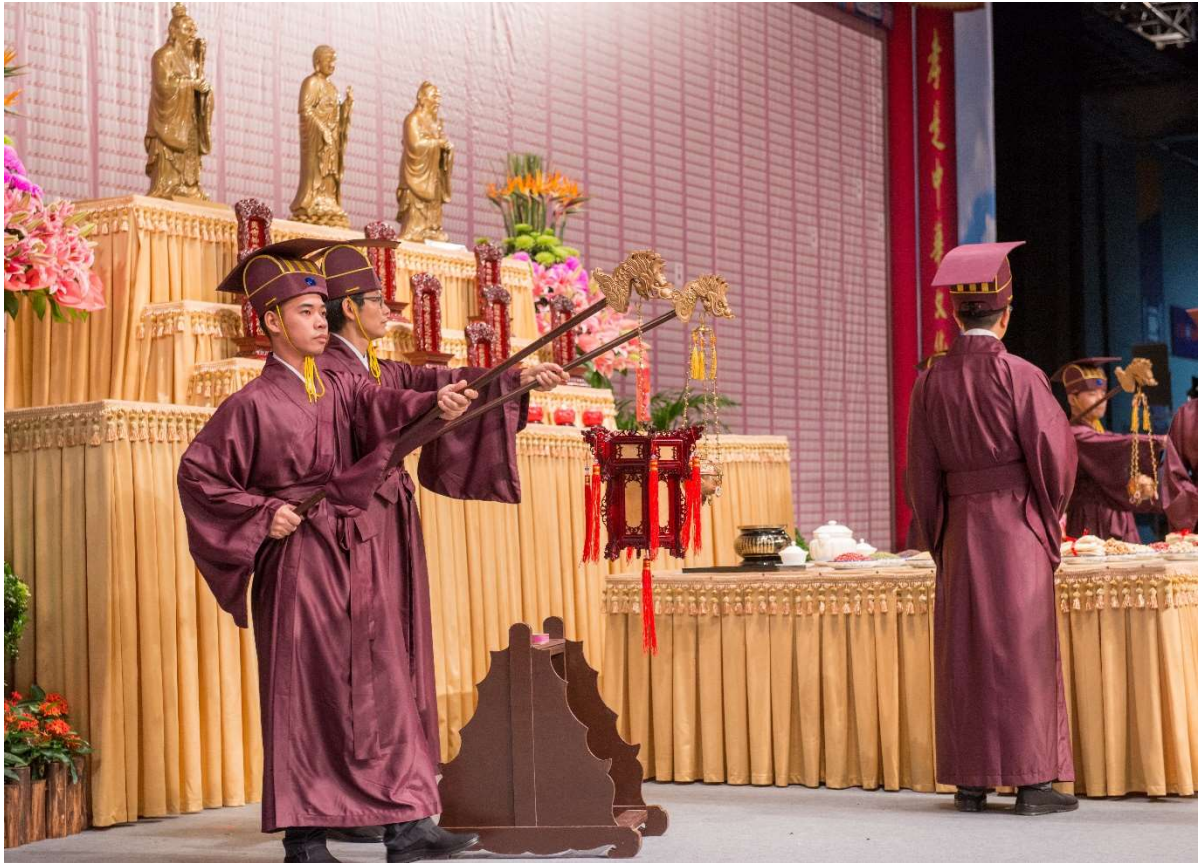
第四聲鼓響出左腳，隨鐘鼓聲自架子外側出班。(7.2)