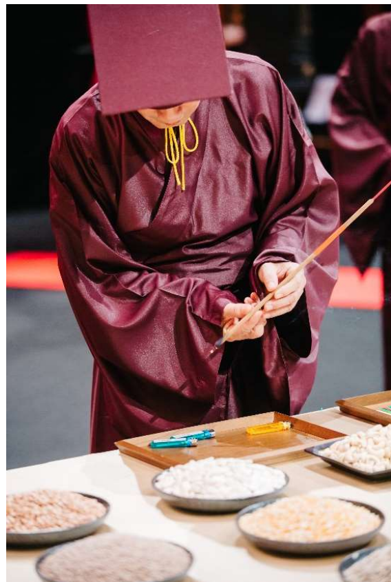
聞通贊唱「上香」，即燃香備用。(10.1)