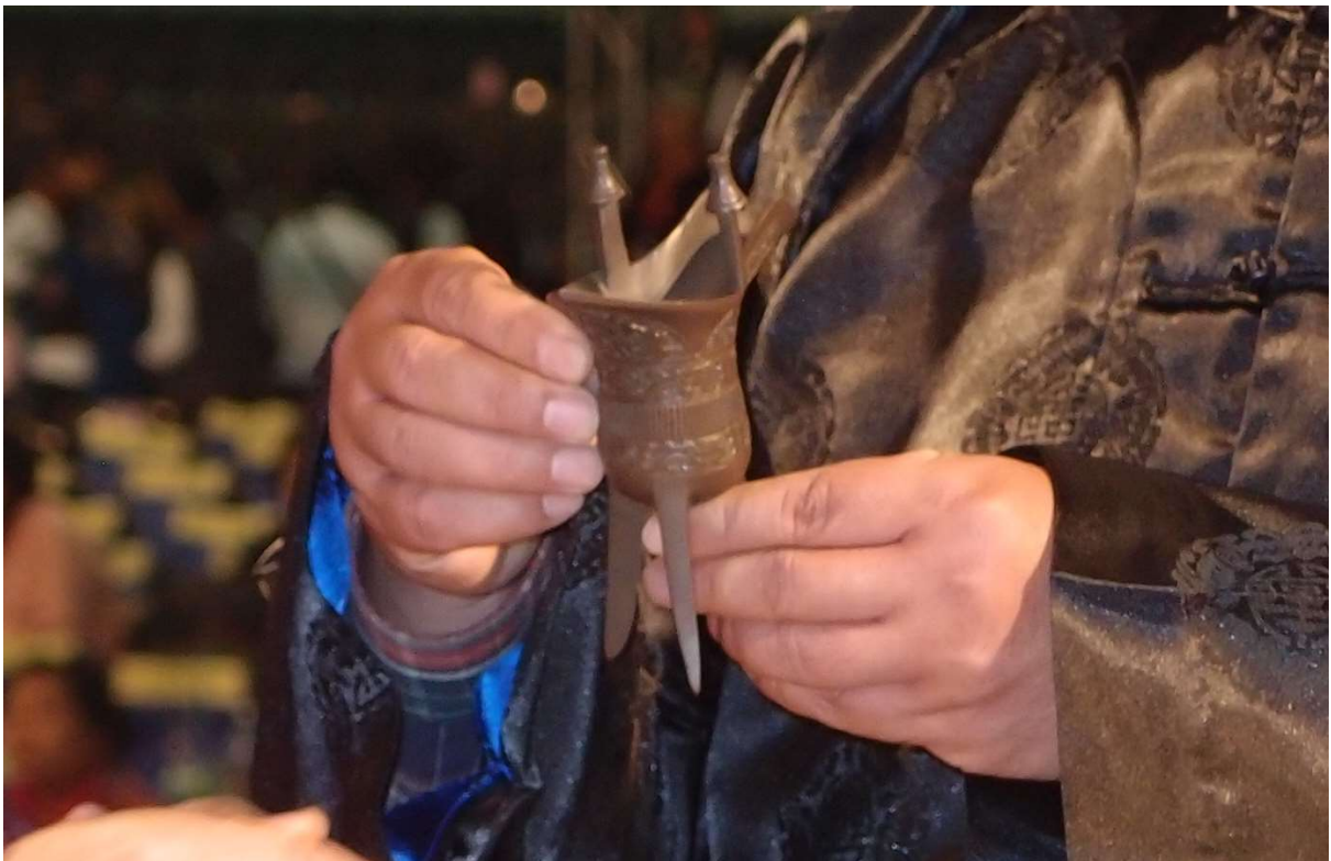
主祭官右手執耳，左手持腳，行獻爵禮或飲福酒。(13.1)