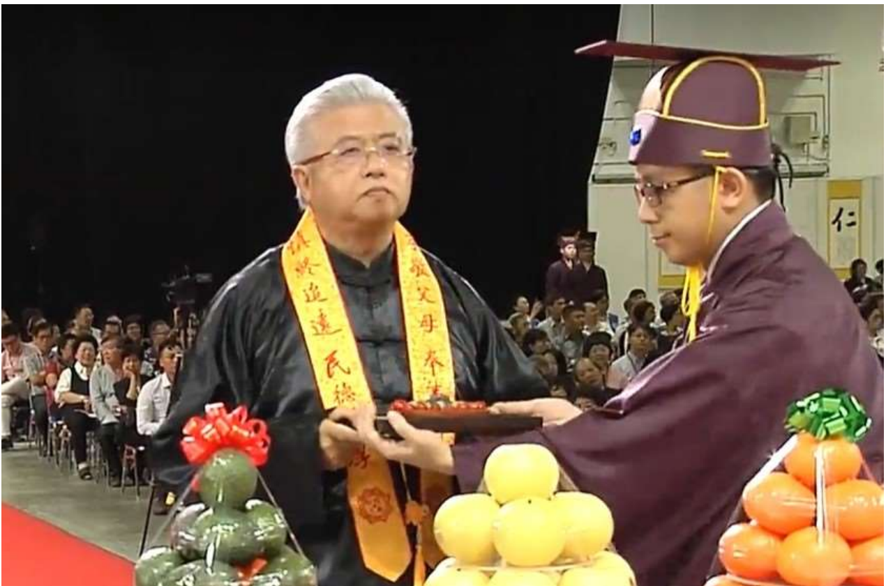
左禮生適時接回，接送時勿令祭官轉身。(14)