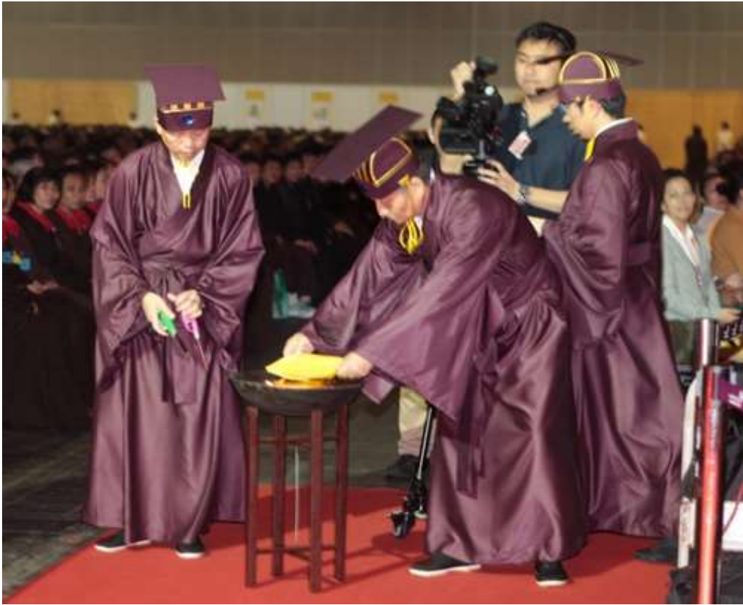
燎所禮生取祝帛後，捧祝帛禮生從右側繞過燎所。(17.3)