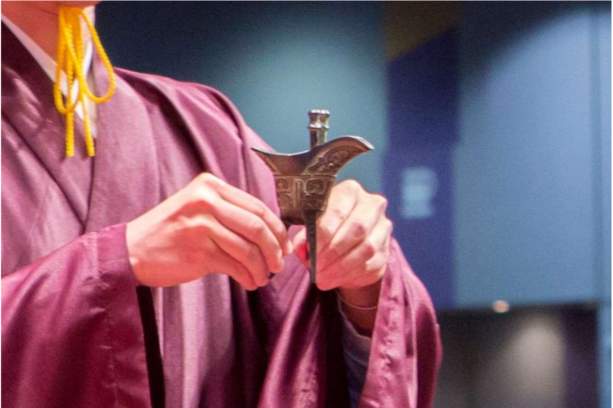
右禮生雙手持爵之兩腳，爵耳居左，呈主祭官。(13.1)