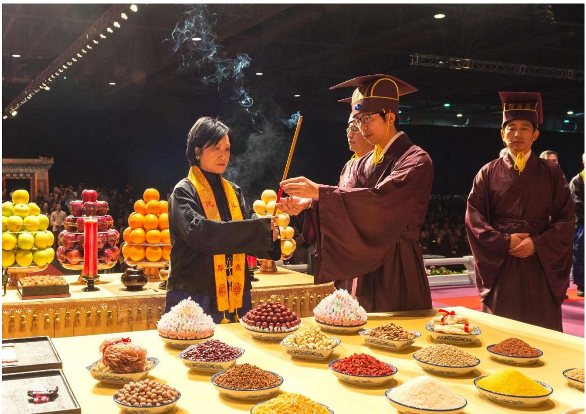
禮畢，左禮生以右禮生方式接香插爐中。(10.2)