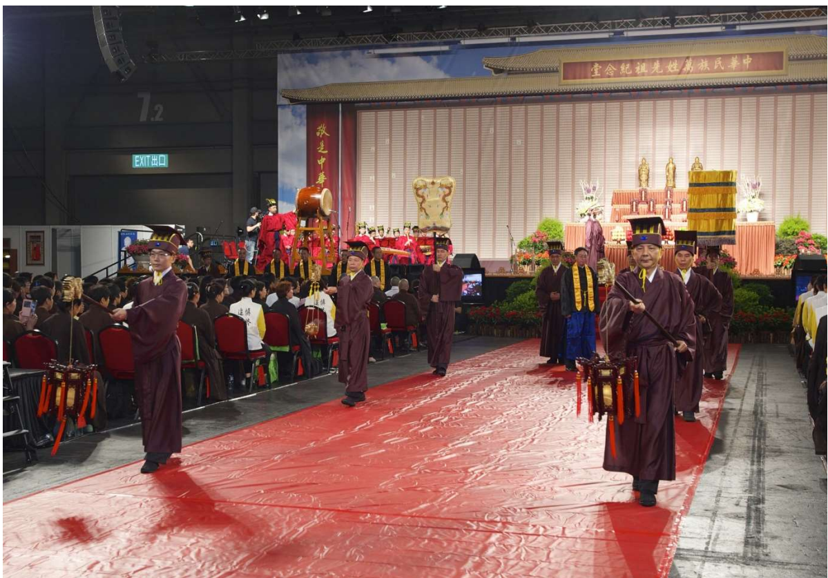
當扇繖經過時，主祭官自右向後轉身。(5.7)