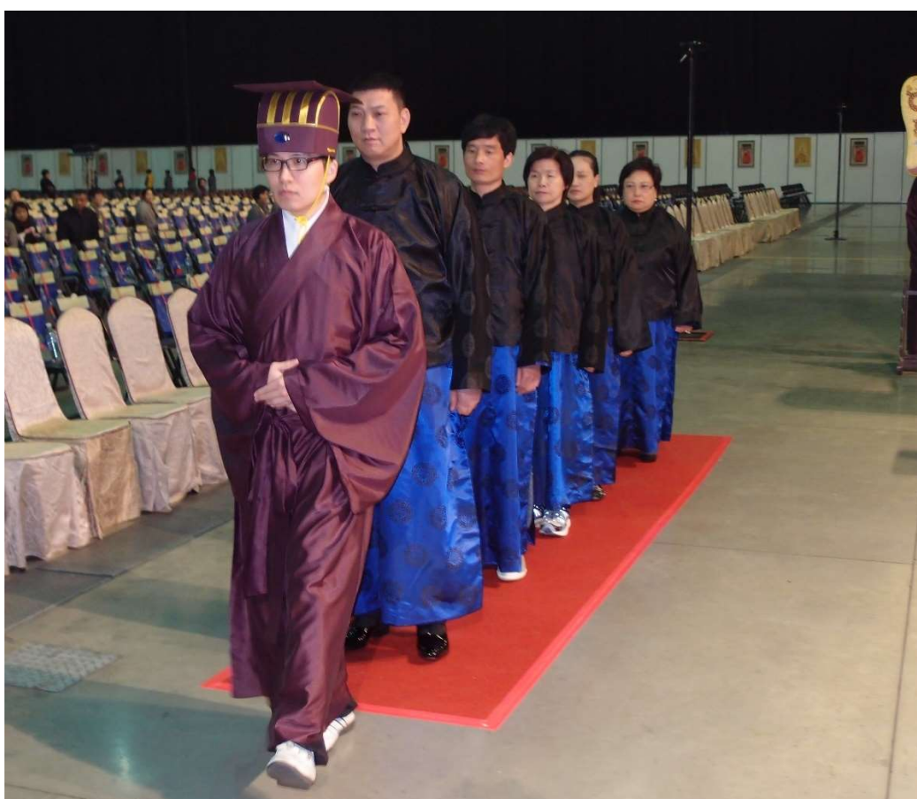
贊生入列歸隊，隨贊生上下舞台就位或復位。(5.6)