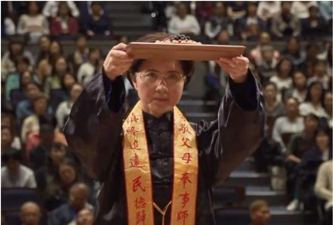
受福果畢，主祭官一舉齊眉。(11)