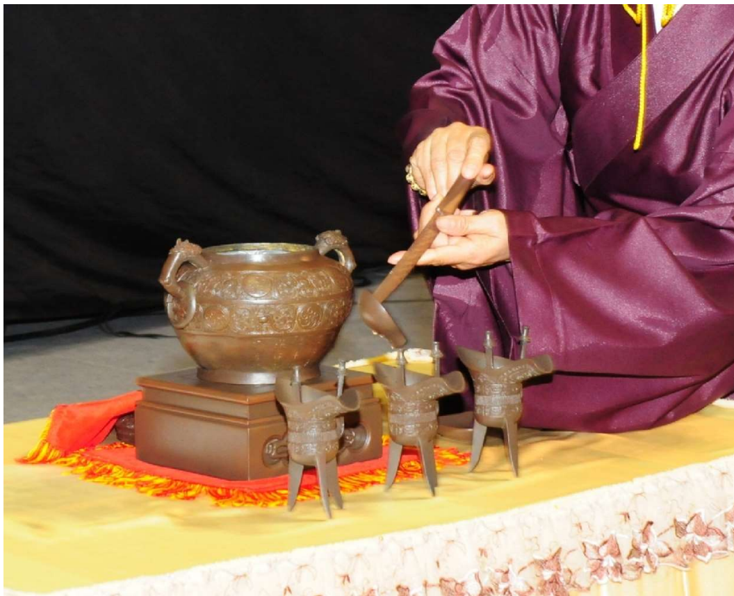
右禮生聞《酒罇生注酒》時轉身，左手在前，右手在後，雙手持勺注酒，酒不宜太滿，注酒畢復位。注酒順序，先中杯。(12.2/3)