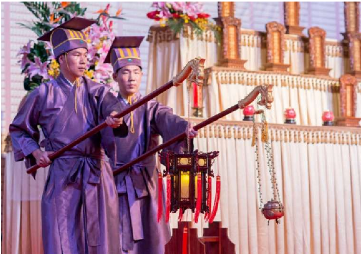
內側手在前，外側手在後緊貼腰，持龍杖，龍頭齊肩。 第三聲鼓響左右轉身，立正。(7.2)