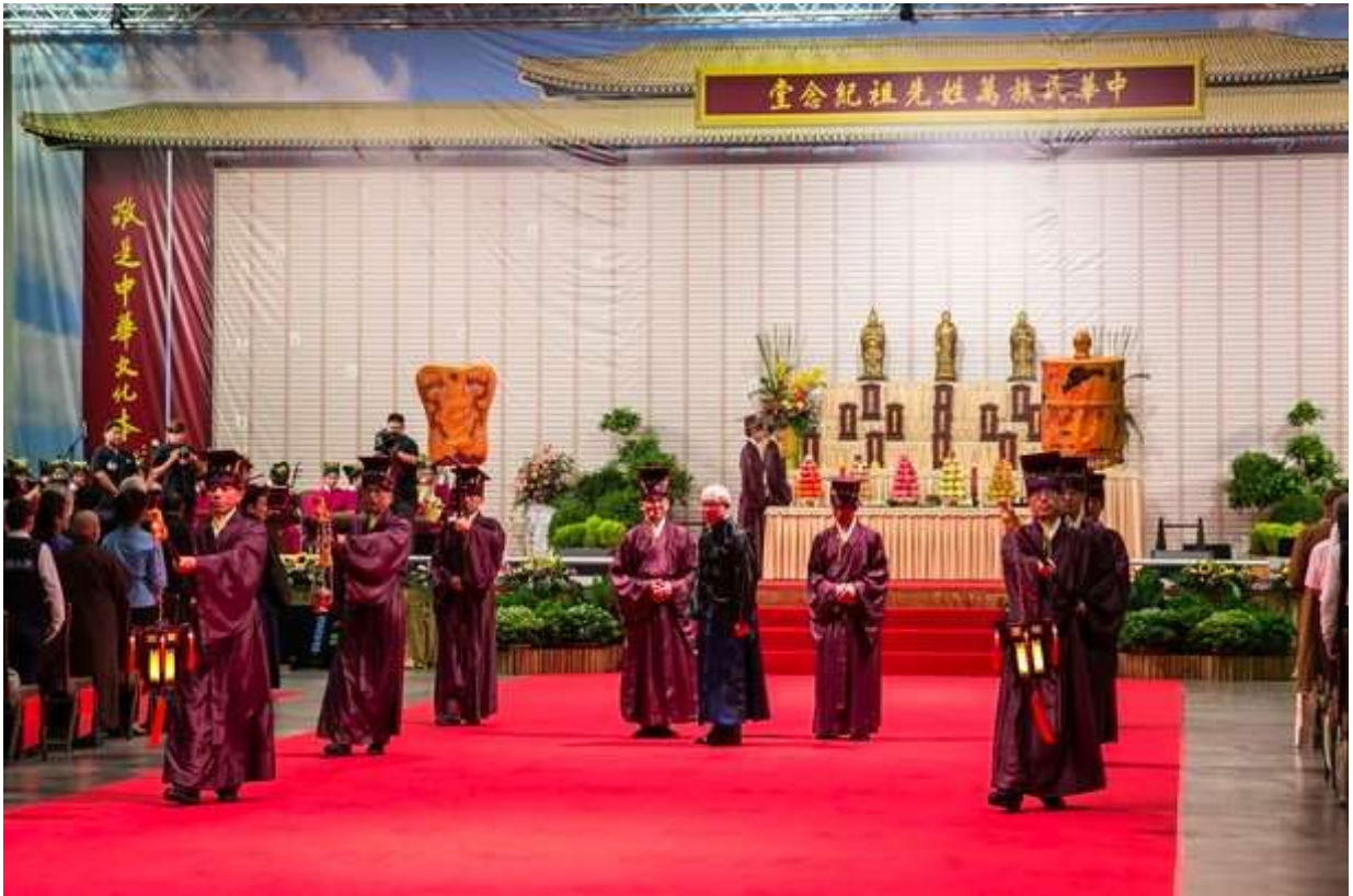
當扇繖經過主祭官時，輕聲提醒所有祭官轉身面對大門或復位。(5.7)