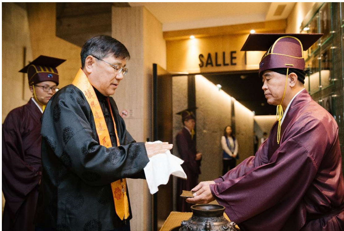
左禮生雙手捧巾盤遞毛巾，呈主祭官擦手，接回後放回原位。(6)