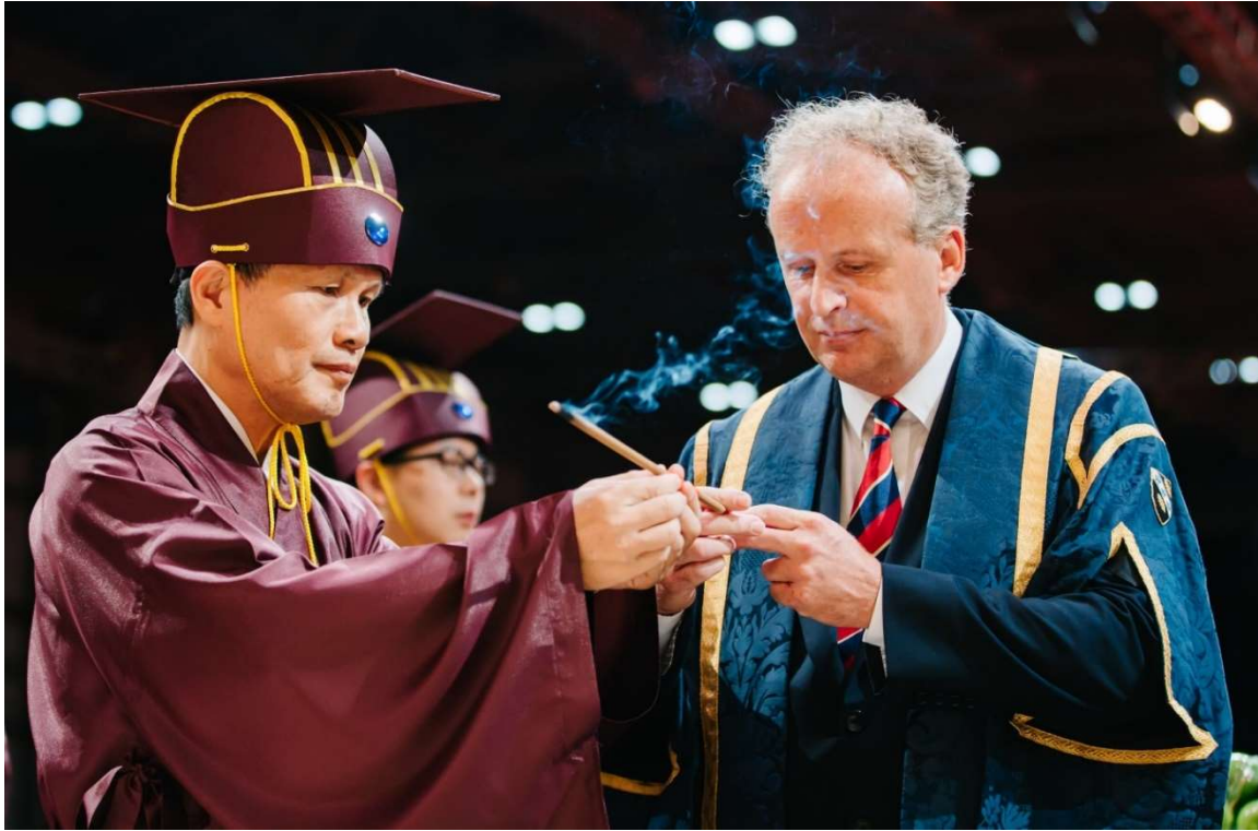
受授時右禮生雙手拇指食指中指捧紅紙內側，香末端朝左，呈主祭官行上香禮。(10.2)