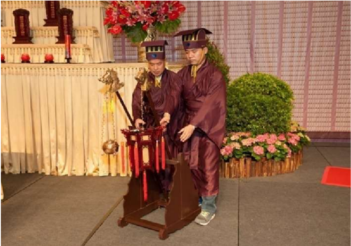
第二聲鼓響跨步彎腰伸手取燈、爐。(7.2)