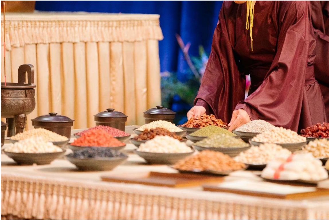
進饌及撤饌時，無蓋者雙手稍稍移動位置。(9)