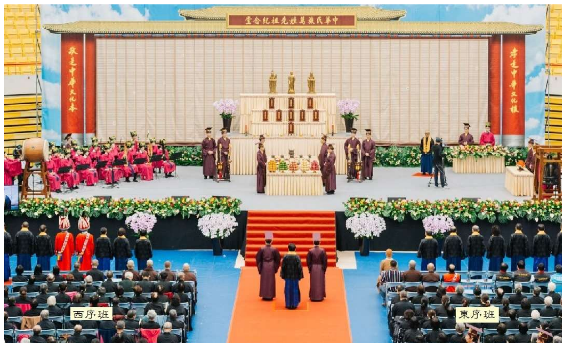
主祭官右邊稱東序班，左邊稱西序班。(1)