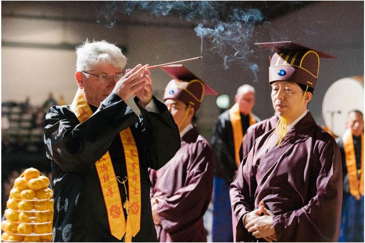
一舉齊眉，行上香禮。(10.2)