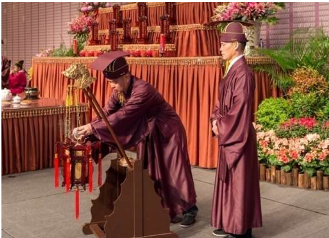
迎神送神前爐須燃香，送神後熄滅。( 7.1)