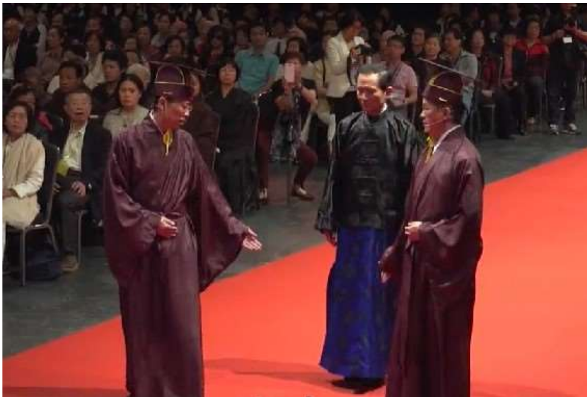
內側手向後比，示意主祭官就定位。(5.1)