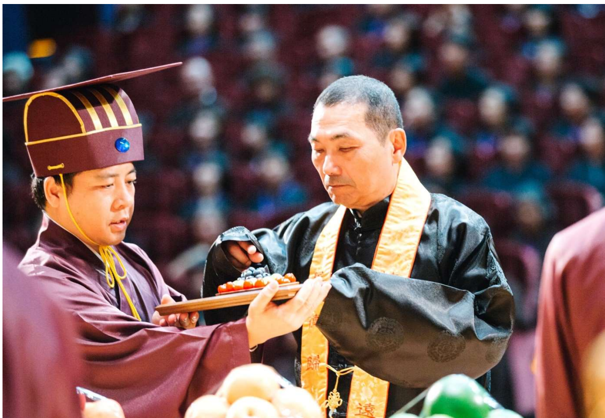
受果時，先以手取一顆淺嘗，始雙手接福盤，再一舉齊眉。(14)