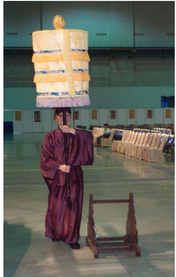
第四聲鼓響出左腳，隨鐘鼓聲走至中間通道左右轉身，隨爐而出。(8.1)