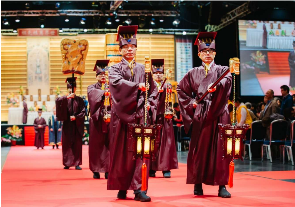
送神：與迎神同，手勢及進出通道相反。(7.3)