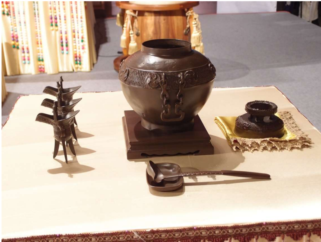
幕摺好置甌後方，蓋覆幕上。(12.1)