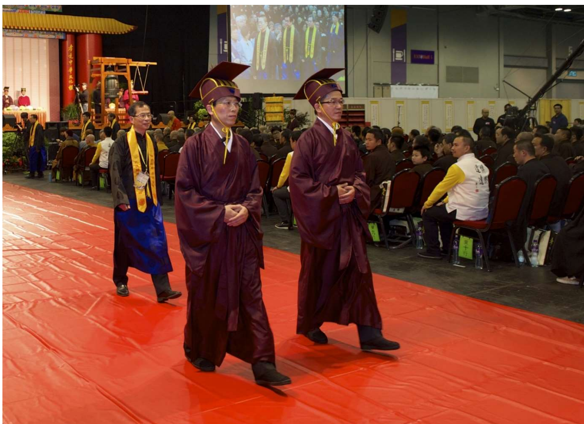
行進時須與主祭官成三角隊形，注意進度要相等，步調要一致。(5.2)