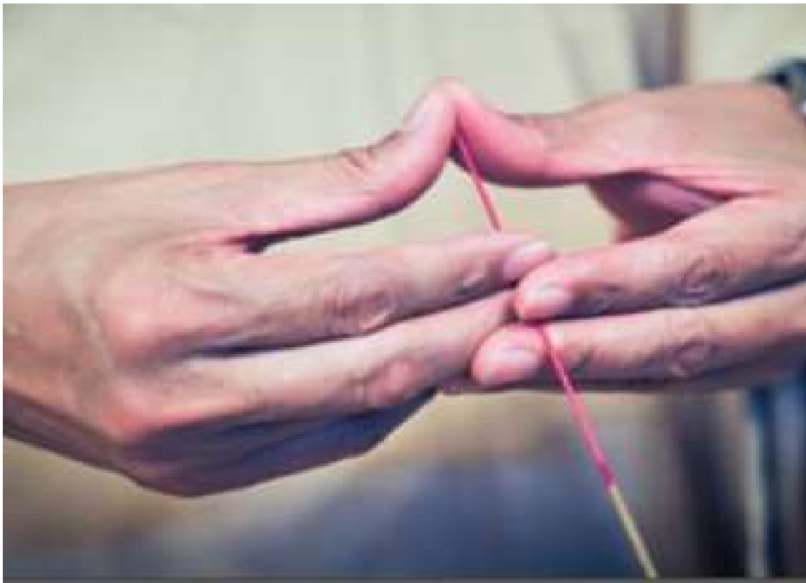
主祭官雙手食指中指夾香腳上端，左手在外右手居內，雙手拇指壓香腳末端，香微翹。(10.2)