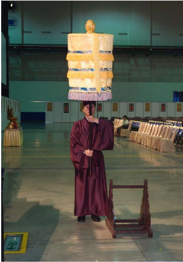
第三聲鼓響向內橫一步，立正。(8.1)