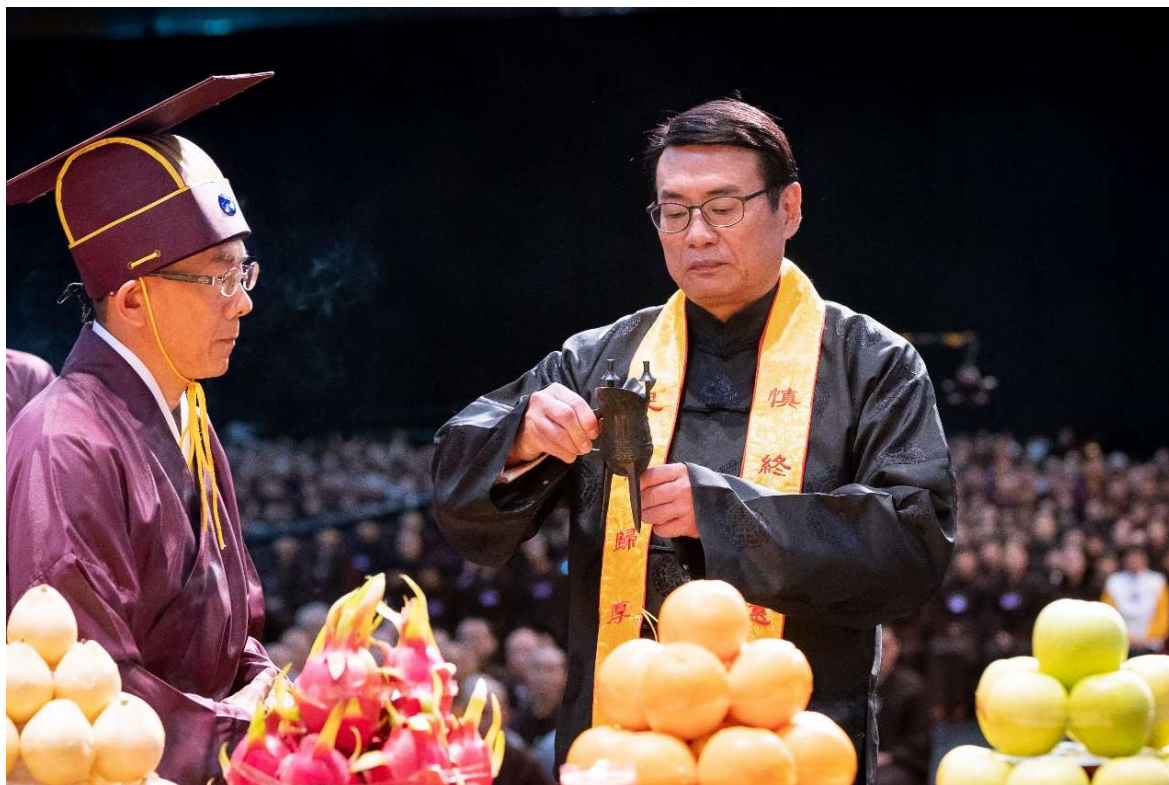
主祭官接妥，胸前稍頓。(14)