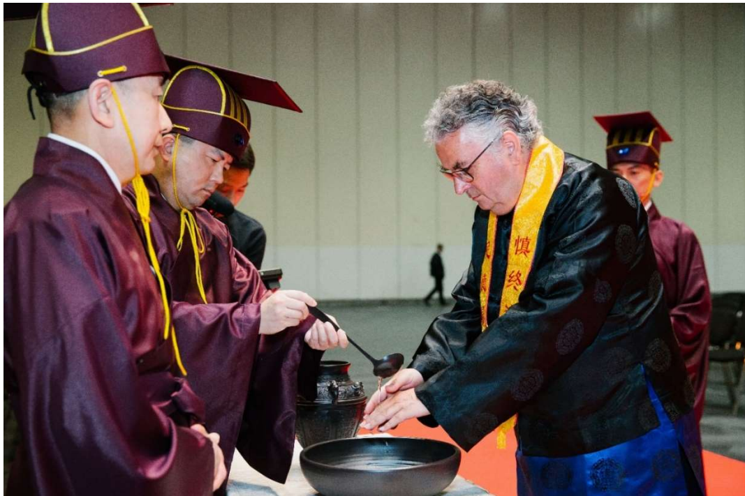
右禮生左手在前，右手在後，雙手持料柄於壺中舀水，於洗上方供主祭官淨手。(6)