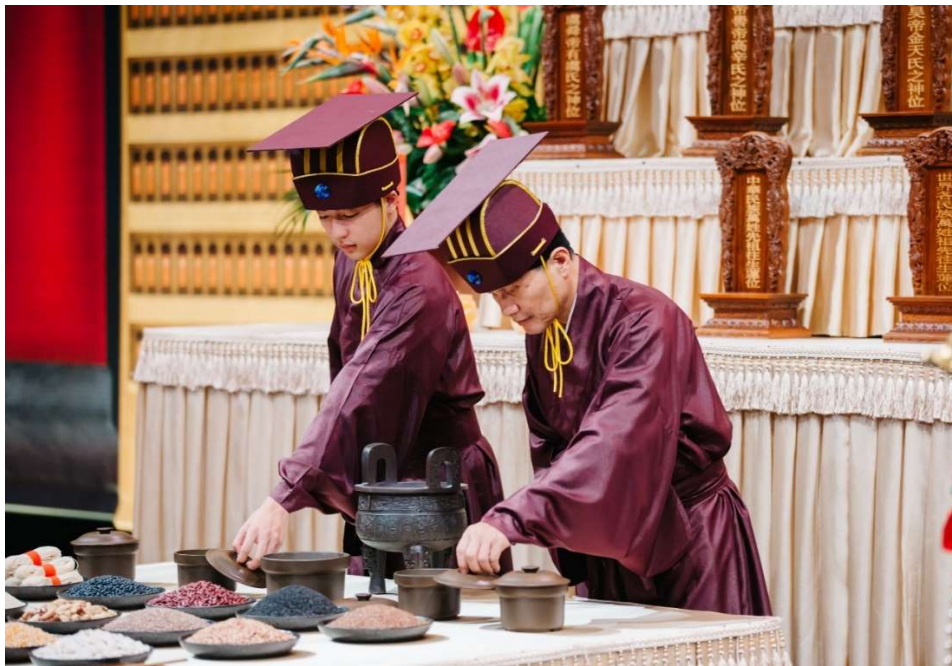
「進饌」樂曲啟奏時，神位前禮生以左手將供桌上有蓋之祭器蓋子掀開，側覆右旁。撤饌時把蓋子蓋回。(9)