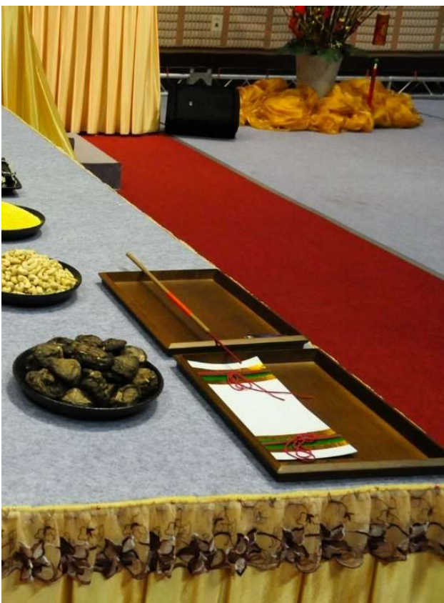
「香」中段貼紅紙一小圈(10.2)